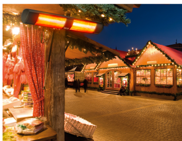
Strahlungsbereich AQUA 3 kW