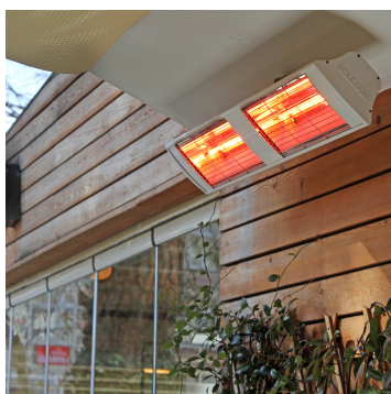
Strahlungsbereich SUPRA 4 kW