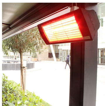
Strahlungsbereich SUPRA 2 kW