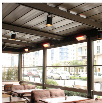
Strahlungsbereich SUPRA 2 kW